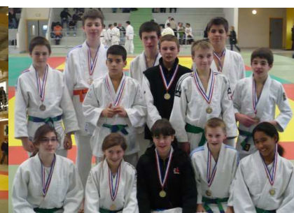
Les 2 équipes minimes sur le podium!!