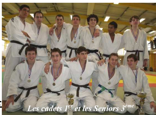
Les cadets 1 er et les Seniors 3 ème